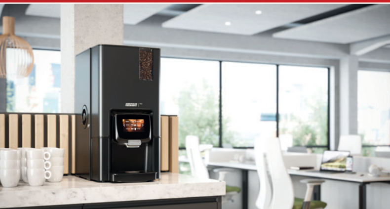
Uw Bravilor Bonamat dealer

Neem voor meer informatie rechtstreeks contact op met Bravilor Bonamat.